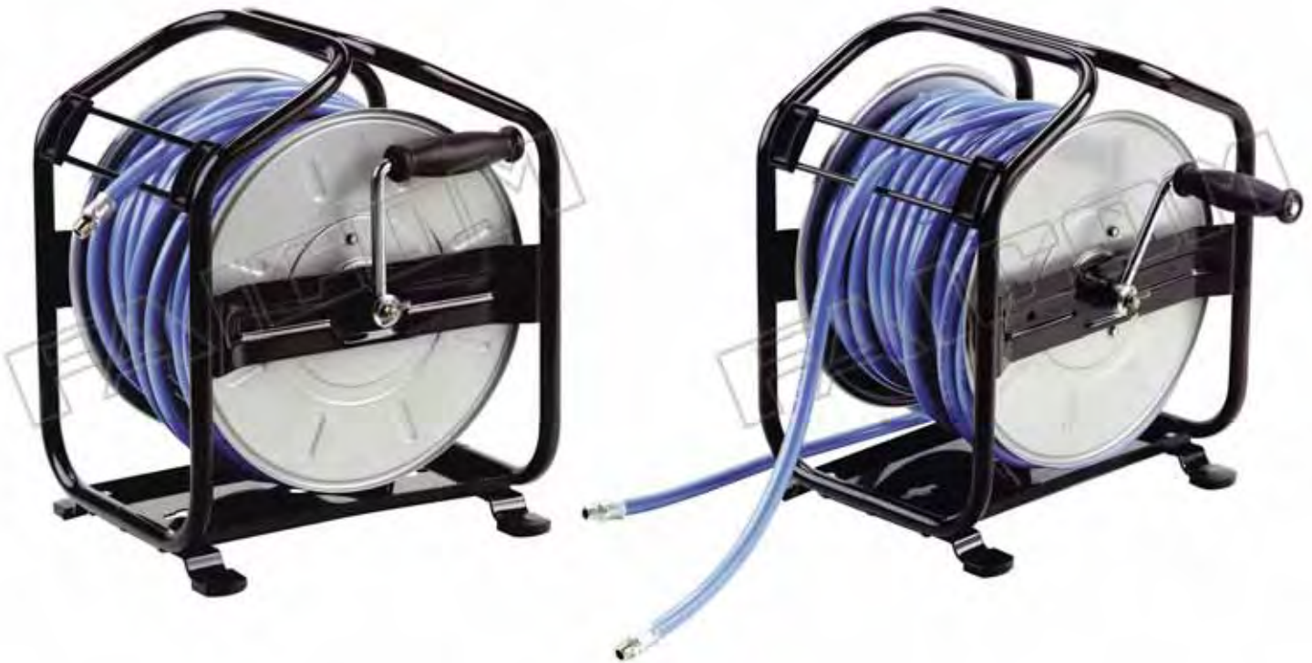
Hose reels model AM with and without hose / Avvolgitubo modello AM con e senza tubo

I modelli completi di tubo sono forniti con tubo flessibile di collegamento lunghezza 2 m.